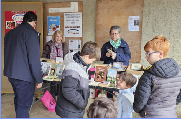
Venta de Libros