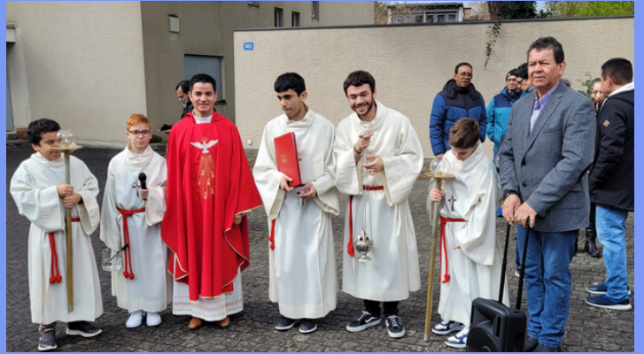
Domingo de Ramos