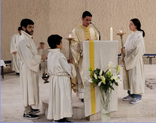
Celebraciones de Pascua