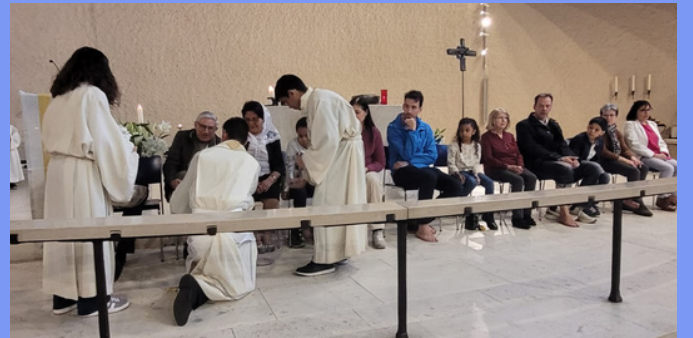
Lavatorio de los Pies