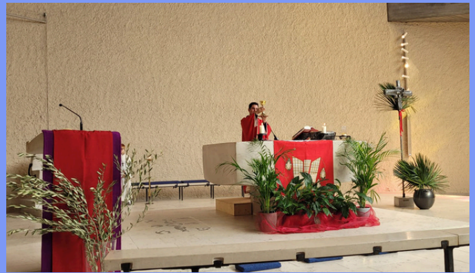
Domingo de Ramos