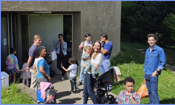
Grupo de Familias