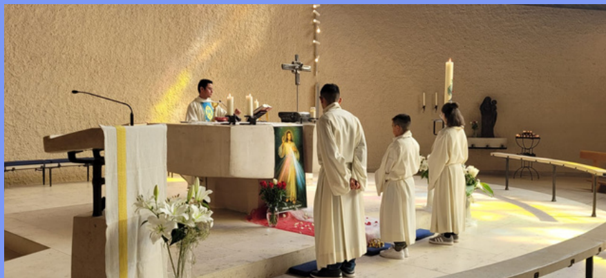
Domingo de la misericordia