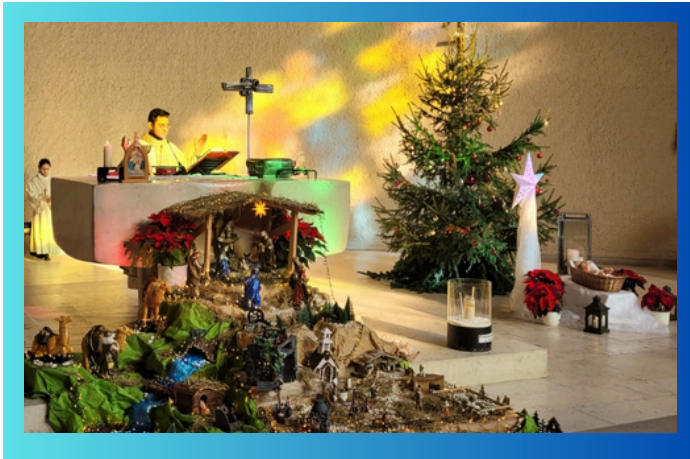
Belén de la comunidad