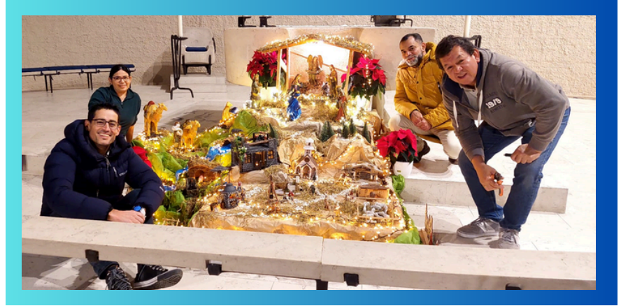
Constructores del Belén