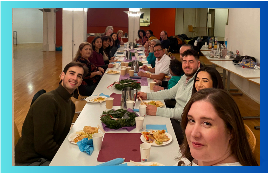
Cena con el Grupo del Coro